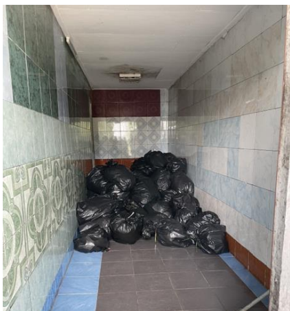
รูปที่ 2-17 จัดเก็บมูลฝอยในถุงดำรวบรวม ไว้ในที่ที่พักรวม