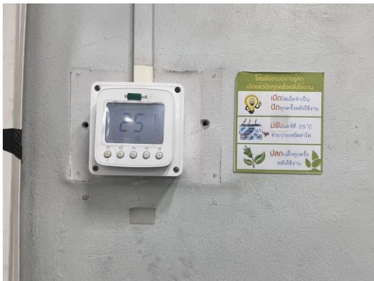
รูปที่ 2-3 แสดงป้ายประชาสัมพันธ์การประหยัดไฟฟ้า และตั้งอุณหภูมิ 25 องศาเซลเซียส