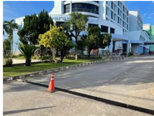
รูปที่ 2-2 คูแฉพื้นที่สีเขียวของโครงการ โดยเฉพาะไม้ยืนต้น