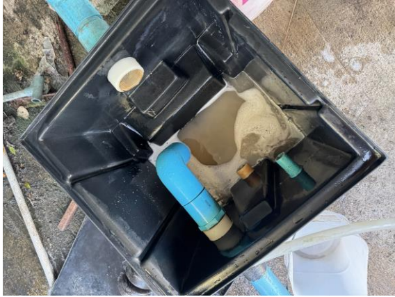
รูปที่ 2-13 แสดงไขมันที่ได้จากการตัดออก จากถังดักไขมัน