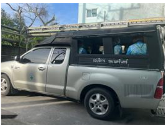
รูปที่ 2-5 ประชาสัมพันธ์ให้เจ้าหน้าที่ของโครงการ และผู้ใช้บริการใช้รถโดยสารสาธารณะ