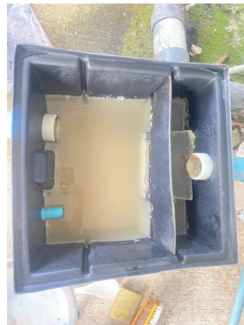
รูปที่ 2-10 แสดงถังดักไขมัน