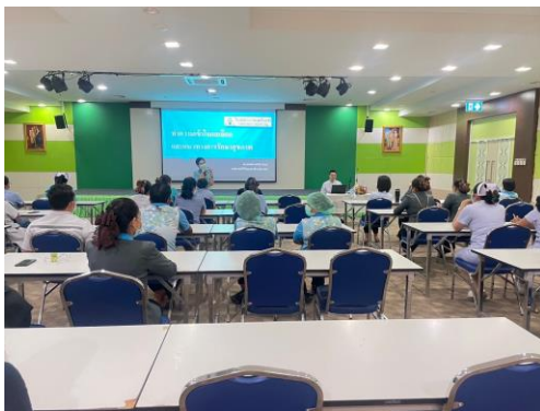
รูปที่ 2-33 จัดให้มีการอบรมให้ความรู้แก่พนักงานเกี่ยวกับกฎระเบียบต่างๆ