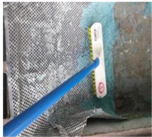
รูปที่ 2-16 ติดตั้งตะแกรงดักขยะที่บ่อพัก (สุดท้าย)