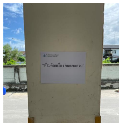
รูปที่ 2-6 แสดงตำแหน่งป้ายเตือน “ห้ามติดเครื่อง ขณะจอดรถ” ไว้ในพื้นที่จอดรถ