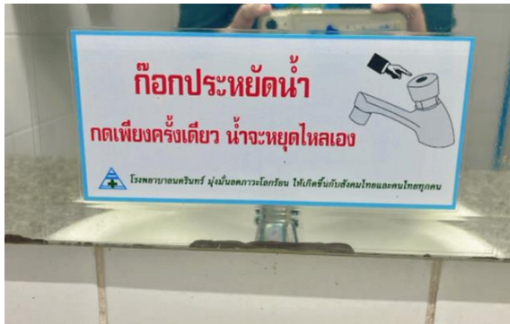
รูปที่ 2-15 ประชาสัมพันธ์ให้ผู้มาใช้บริการ และพนักงานใช้น้ำอย่างประหยัด