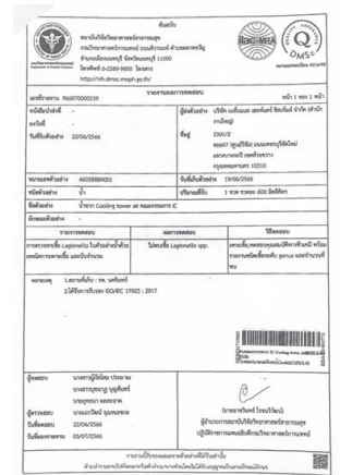
รูปที่ 2-4 แสดงการตรวจเช็คลิจีโอเนลล่า