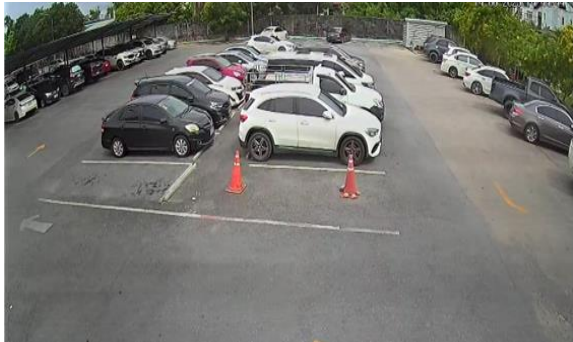
รูปที่ 2-25 จัดให้มีที่จอดรถ