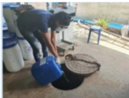
รูปที่ 2-11 บำรุงรักษาดังถังบำบัดน้ำเสีย