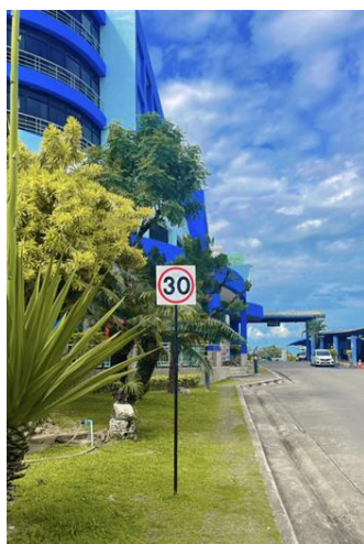
รูปที่ 2-29 ติดตั้งป้ายจำกัดความเร็วของรถไม่เกิน 30 กิโลเมตร/ชั่วโมง