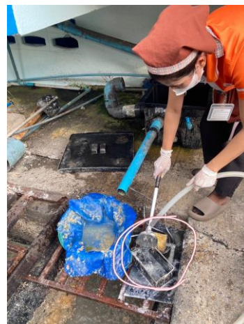
รูปที่ 2-12 แสดงการดักไขมันออกจากถังดักไขมัน เป็นประจำทุกวัน