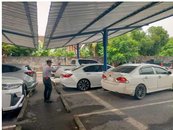
รูปที่ 2-27 จัดให้มีเจ้าหน้าที่อำนวยความสะดวก บริเวณลานจอดรถยนต์