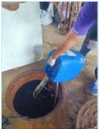
รูปที่ 2-9 แสดงถังบำบัดน้ำเสียภายในโครงการ