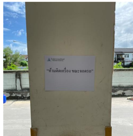
รูปที่ 2-28 ติดตั้งป้ายเตือน "ห้ามติดเครื่อง ขณะจอดรถ"