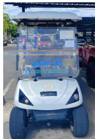
รูปที่ 2-30 จัดให้มีรถกอล์ฟ อย่างน้อย 2 คัน