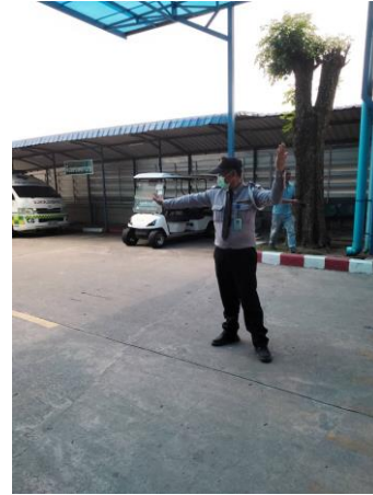
รูปที่ 2-26 จัดให้มีเจ้าหน้าที่อำนวยความสะดวก ด้านการจราจร