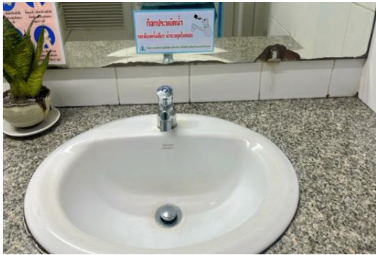
รูปที่ 2-7 ติดสติ๊กเกอร์รณรงค์การประหยัดน้ำ ที่บริเวณอ่างล้างมือ