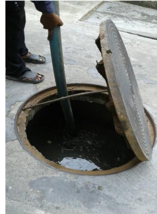
รูปที่ 2-14 กำหนดให้สูบลูกบอลจากถังแยกตะกอน