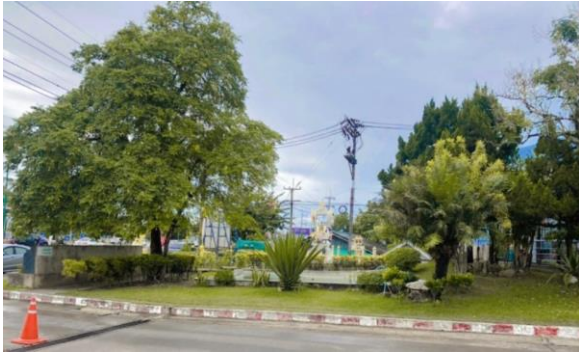
รูปที่ 2-1 แสดงพื้นที่สีเขียวภายในโครงการ