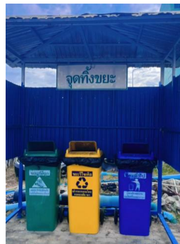
รูปที่ 2-18 เลือกใช้สีของถังรองรับมูลฝอย ตามประเภทของมูลฝอย